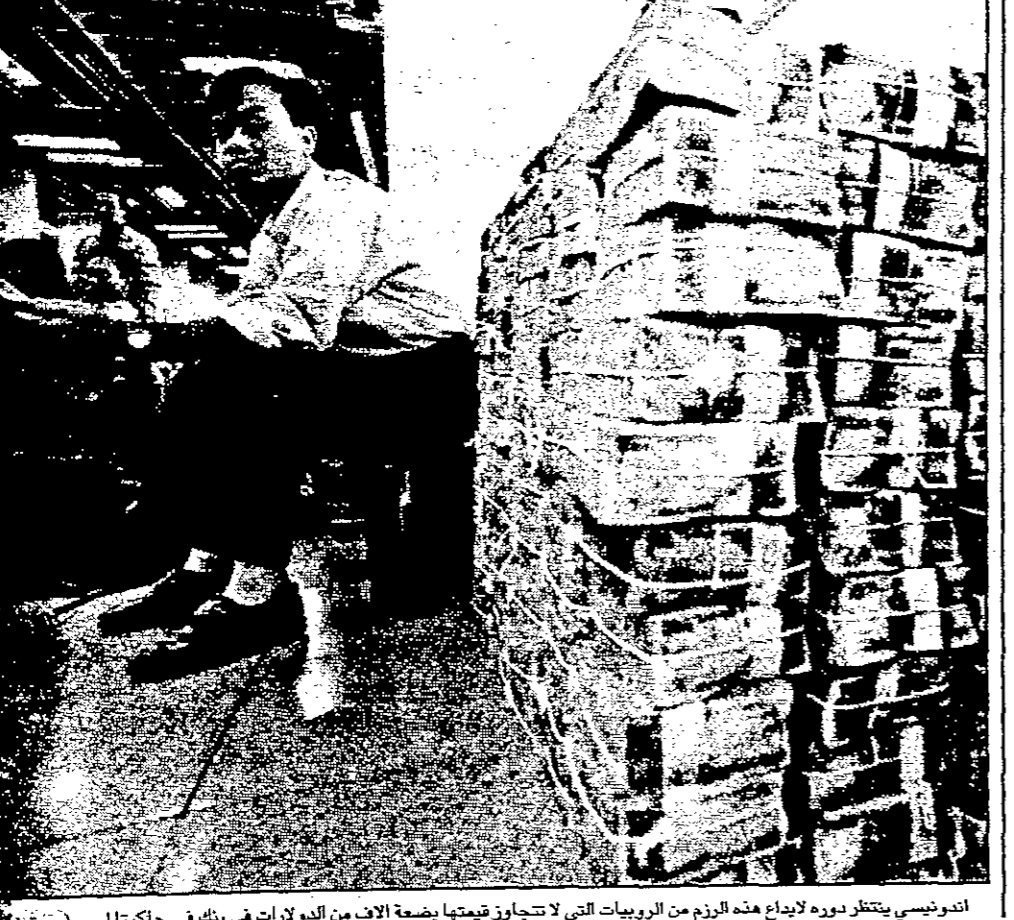
اندونيسي يتنظر دوره لادراج هذه الزم من البرويات التي لا تتجاوز قيمتها بضعة الاف من الدولارات في بنك في جاكرتا امس